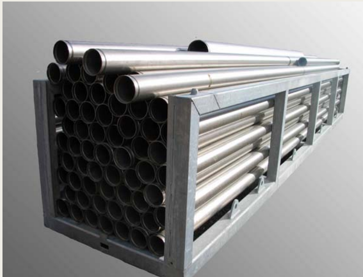
Tubos de acero inoxidable