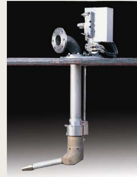
Máquinas de limpieza