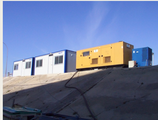
Generador eléctrico Compresor de aire